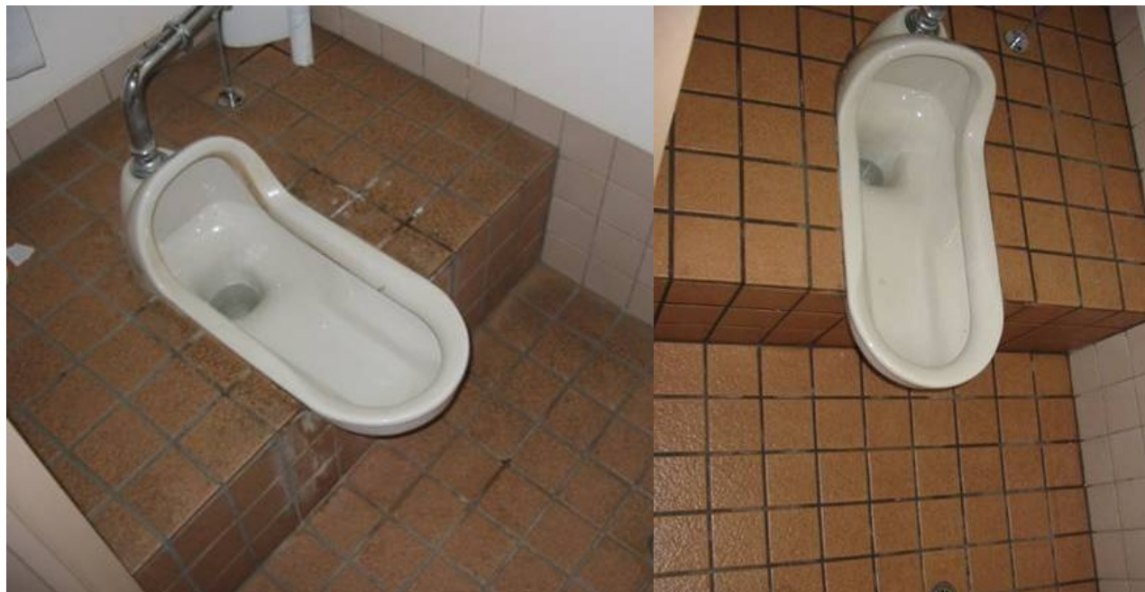
便器内部もコート施工